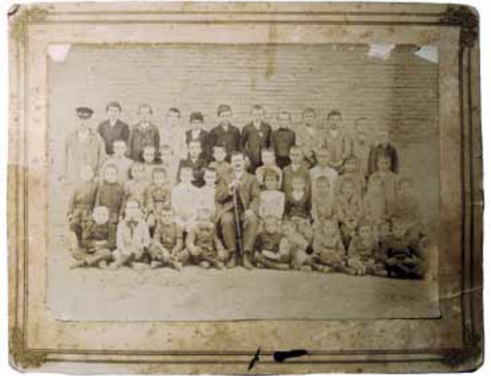
Sant'Angelo in Lizzola, 1906 - 1907. Scolaresca