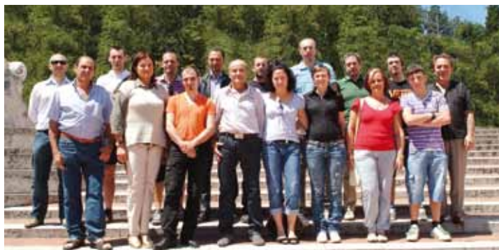
Il Consiglio direttivo dell'AVIS locale

Si può donare sangue al Distretto Sanitario di Montecchio in via Pio La Torre 92: il donatore sarà avvisato ogni volta con un sms sul proprio cellulare. Grazie alle visite periodiche, completamente gratuite, il donatore potrà così anche controllare il proprio stato di salute. Ai lavoratori dipendenti, inoltre, verrà riconosciuta per legge una giornata di riposo retribuita. Per info chiamare in qualsiasi momento al numero 0721 490552: risponderà un componente del direttivo che potrà fornire tutte le indicazioni per diventare donatore.