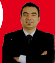
Il Sindaco Guido Formica