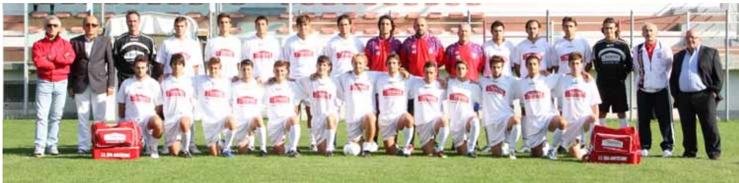
La formazione al completo del Real Montecchio

E' un 2010 che il Real Montecchio non dimenticherà facilmente: retrocessione in Eccellenza dopo dieci campionati di fila in Serie D, con due secondi posti timbrati nel 2003 e nel 2007, ma anche una svolta societaria che ha riportato entusiasmo e riorganizzazione. I primi risultati? L'atteso ritorno alla vittoria, dopo un anno esatto, tra le mura amiche dello "Spadoni" e una storica quanto pirotecnica affermazione sui cugini nobili della Vis al "Benelli". Non era mai accaduto in 45 anni di storia