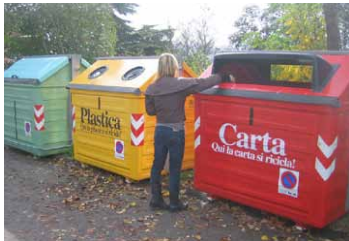
Il conferimento dell'immondizia di una cittadina

Si ricorda che è sempre attivo il servizio gratuito di ritiro a domicilio degli ingombranti (mobili vecchi, materassi, divani, armadi, letti, tavoli, elettrodomestici