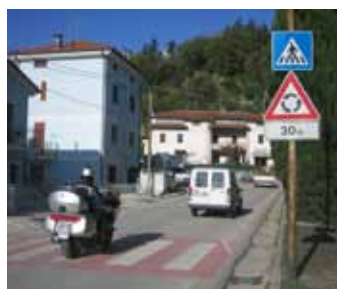
A sinistra via E. Fermi, a destra via S. Michele

Dal punto di vista operativo significa fare in modo che l'ente locale riesca maggiormente e più rapidamente a soddisfare il cittadino nell'erogazione del servizio attivando un livello di comunicazione basato sulla fiducia reciproca che è di ausilio anche agli organi di governo. Significa, inoltre, mantenere il rapporto tra l'Ente ed i cittadini, introducendo al proprio interno degli indicatori sociali che riescano meglio a delineare la vera attività del settore pubblico locale comunicando con i portatori di interesse esterni.