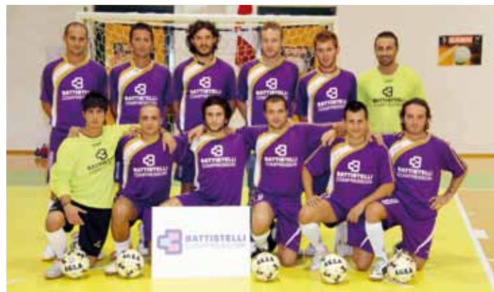
La Folgore Calcio a 5 al completo

fermo da tre anni dopo essersi rotto due volte il ginocchio. "Avere lui è come avere Pelè - spiega Rivi -. Recuperando tutti possiamo fare la nostra figura". Appuntamento al PalaDionigi.