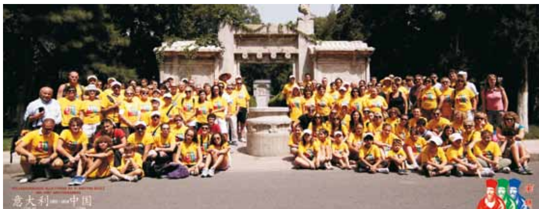
Il gruppo dei 133 pellegrini sulle tracce di Padre Matteo Ricci Li Ma Dou