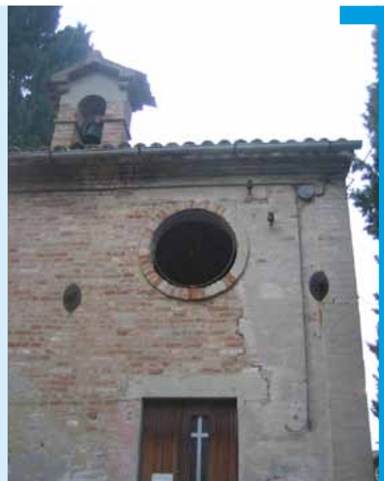
La Chiesa del cimitero di Montecchio