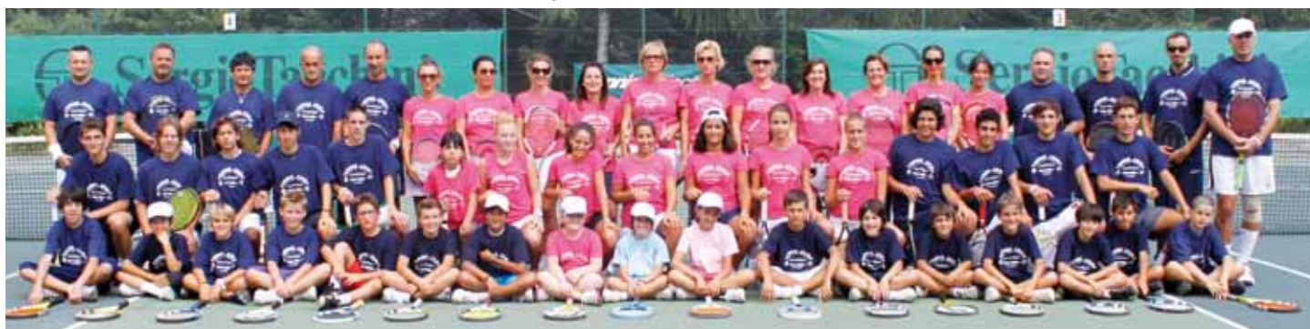
Il Circolo Tennis Montecchio al campus estivo di Brentonico in Trentino.

Tennis, gli under Maggioli e Santi hanno vinto la Coppa Pia con la rappresentativa Marche CT Montecchio, giovani talenti crescono