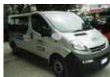
Il nuovo progetto dell'AUSER che aiuta e accompagna gli anziani con un pulmino comprato grazie i fondi del 5 per mille